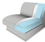
Kaltschaum gegen Aufpreis