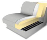
PUR-Schaum auf Wellenfedern (Standard)